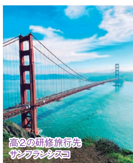
高2の研修旅行先 サンフランシスコ

して男子と女子がいますので、 正にこの学校のなかに、小さな 地球が入っているような環境 で国際性を養うことができます。 インターナショナルスクール とコラボすることで異文化交流 と相互理解が深まります。ダイ バーシティを実感できるから 実は人類に国境などないとい う