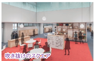
吹き抜けのスクエア