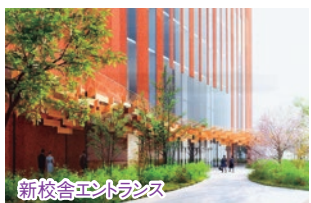
新校舎エントランス