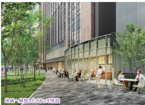
地域へ解放したカフェを併設