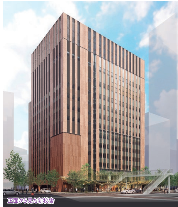
正面から見た新校舎